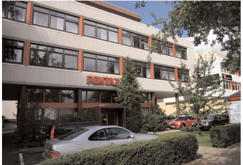
Europazentrale von Pentax in Hamburg