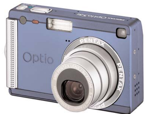
Pentax Optio S5i Digitalkamera (5 Megapixel)

Für Pentax war es sehr wichtig, dass seine Mitarbeiter mit der Technik problemlos umgehen können. Letztlich sollte die visuelle Kommunikation genauso verlässlich und einfach sein wie telefonieren. Aus diesem Grund wurden vorab kleine Workshops veranstaltet und ein internes Benutzerhandbuch erstellt. Eine Umfrage unter den Mitarbeitern über die Nutzung des Systems brachte durchweg positive Ergebnisse. Vorteile