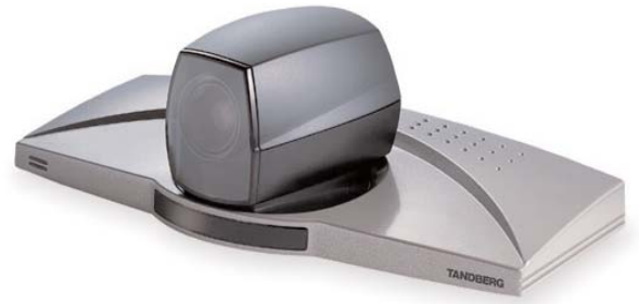
Pentax vertraut auf das Videosystem TANDBERG 880

TANDBERG ist ein weltweit führender Anbieter von Produkten visueller Kommunikation und zugehöriger Dienstleistungen. Das Unternehmen unterstützt Organisationen beim effizienten Einsatz visueller Kommunikationsmethoden. Branchenspezifisches Wissen und ein ausgeprägter Beratungsansatz erlauben es TANDBERG-Kunden, neue Kommunikationsmöglichkeiten zu erschließen. TANDBERG treibt den Einsatz visueller Kommunikation durch standardbasierte Lösungen voran. Das Unternehmen verfügt über einen doppelten Firmensitz in New York und in Norwegen und hat bereits Kundenprojekte in mehr als 90 Ländern realisiert. TANDBERG notiert an der Osloer Börse unter dem Kürzel TAA.OL. Weitere Informationen zu TANDBERG finden Sie unter www.TANDBERG.net .