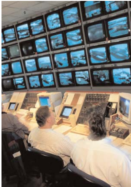
Immer alles im Blick mit den Pentax CCTV-Objektiven

wurden vor allem in der Zeitersparnis bei gleicher Arbeitsqualität gesehen. Projekte oder Probleme können schnell und einfach via Videokonferenz erläutert und dargestellt werden, ohne umständlich Meetings planen zu müssen.