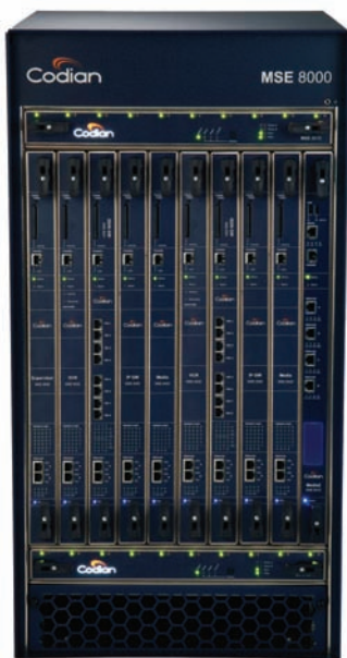
MSE 8000 Chassis

Die überaus stabile Media Services Engine 8000 bietet eine besonders hohe Kapazität und ein Audio-/Videokonferenz-Chassis der Carrier-Klasse. Sie verfügt über eine integrierte Systemüberwachung, extrem flexible Feature-Blades, redundante, überwachte Netzteile sowie ein Kühlsystem. Weitere Hauptmerkmale sind: