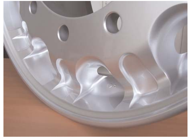
Detailansicht eines modernen Qualitäts-Rades von Hayes Lemmerz

Das oberste Ziel für Hayes Lemmerz ist eine gute Qualität der Videokonferenz und eine robuste Technik. Doch bereits nach kurzer Zeit hat das Management auch die Vorteile für eine bessere Teamführung erkannt. Zudem machen Videokonferenzen einen stärkeren persönlichen Kontakt möglich, z.B. wenn sich Mitarbeiter in Europa von Angesicht zu Angesicht miteinander und mit ihren Kollegen in Indien oder Japan unterhalten können. Das führt nicht nur zu effektiverem Arbeiten sondern vertieft auch die kulturellen und geschäftlichen