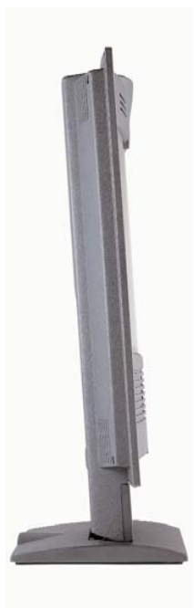
TANDBERG Centric 1000 MXP

TANDBERG HAUPTSITZ Philip Pedersens vei 20 1366 Lysaker, Norwegen Tel: +47 67 125 125 Fax: +47 67 125 234 Video: +47 67 126 126 E-Mail: tandberg@tandberg.net