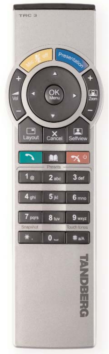
Intuitive und simple Bedienung einer hochentwickelten Technologie: Die TANDBERG Fernbedienung