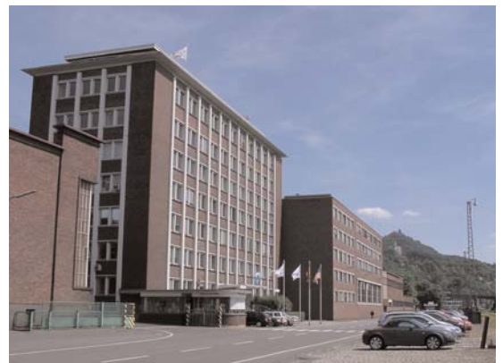
Die Deutschlandzentrale von Hayes Lemmerz in Königswinter

Hayes Lemmerz setzt Videokonferenztechnik von TANDBERG seit Mai 2006 ein. Das Ziel ist letztlich die Vernetzung aller Standorte, die immerhin über vier Kontinente verteilt sind. Gestartet wurde das Projekt in Europa. Die Videokonferenzen außerhalb der USA werden über einen Server in Tschechien geführt. Die neue Videotechnik erfreut sich bei Hayes Lemmerz mittlerweile großer