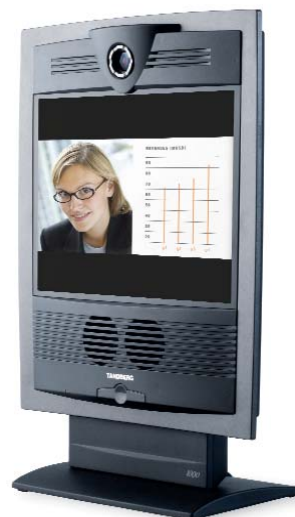
Im täglichen Einsatz bei Hayes Lemmerz: Die TANDBERG Centric 1000 MXP

TANDBERG ist ein weltweit führender Anbieter von Produkten visueller Kommunikation und zugehöriger Dienstleistungen. Das Unternehmen unterstützt Organisationen beim effizienten Einsatz visueller Kommunikationsmethoden. Branchenspezifisches Wissen und ein ausgeprägter Beratungsansatz erlauben es TANDBERG-Kunden, neue Kommunikationsmöglichkeiten zu erschließen. TANDBERG treibt den Einsatz visueller Kommunikation durch standardbasierte Lösungen voran. Das Unternehmen verfügt über einen doppelten Firmensitz in New York und in Norwegen und hat bereits Kundenprojekte in mehr als 90 Ländern realisiert. TANDBERG notiert an der Osloer Börse unter dem Kürzel TAA.OL. Weitere Informationen zu TANDBERG finden Sie unter www.TANDBERG.net .