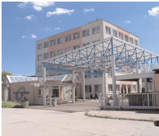
Der Standort im tschechischen Ostrava. Hier steht der Server für alle Videokonferenzen außerhalb der USA